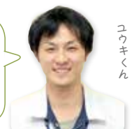
ごみのおじさん こうきくん