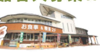
ウミガメ公園 スタッフ 前田

ウミガメ公園 ☎ 0735-33-0300 紀宝町井田568番地7 営業時間: AM8:30 ~ PM7:00