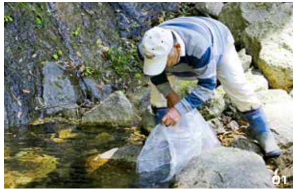
01. アマゴの稚魚を放流。02. 元気に泳ぐアマゴの稚魚