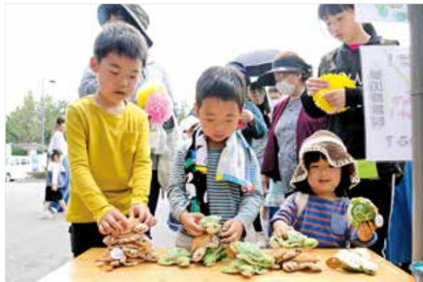
ぬいぐるみを積み上げる子どもたち