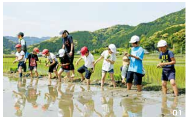
01. 田植えをするため田んぼに足を踏み入れる児童たち。02. 竹定規を使いすじつけにも挑戦。