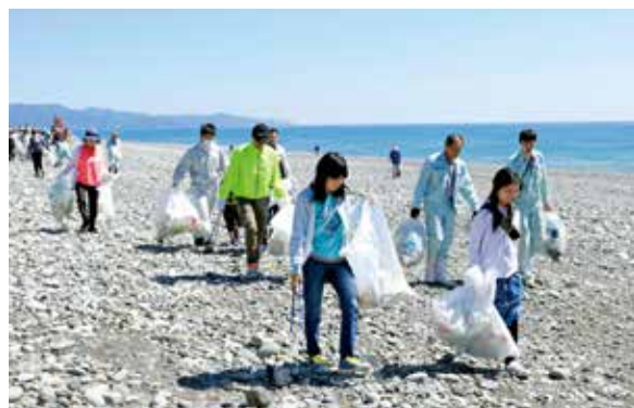
海岸を人海戦術で清掃する参加者たち