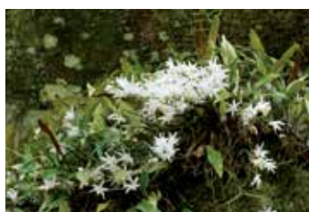
神内神社のセッコク