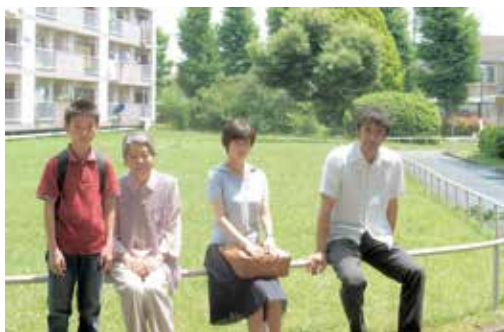
「海よりもまだ深く」© 2016 フジテレビジョン パンダイビジュアル AOI Pro. ギャガ

【料金】無料（役場企画調整 課で6月5日(月)から配布する 整理券が必要です。）