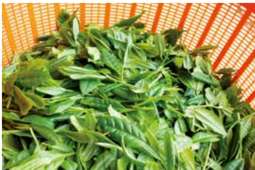
いっぱいお茶の葉っぱを摘みました