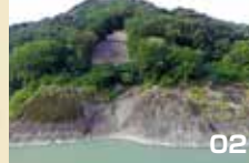
02. 足跡がある文字岩付近。