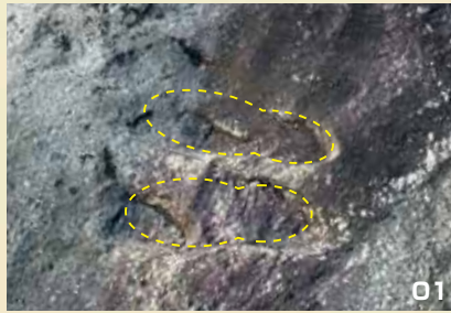
01. 熊野川にある弁慶の足跡。

今回の珍百景は、前回に引き続き町に伝わる弁慶伝説として、町内に2か所ある「弁慶の足跡」をご紹介します。