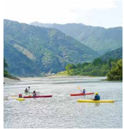
昨年のカヌー教室

参加にはお申込みが必要ですので、募集期間にご注意のうえ、ぜひお申し込みください。