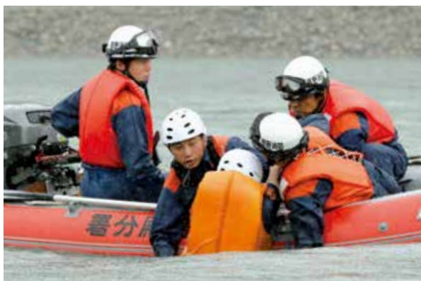
川に流された人を救助する訓練