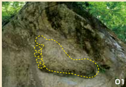
01. 平尾井薬師堂上の巨石にある弁慶の足跡。