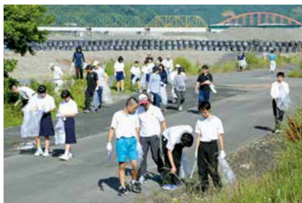
ゴミ拾いをする参加者たち