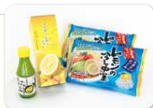
マイヤーレモン商品詰め合わせ (冷やし中華、ジュレ、100%果汁)