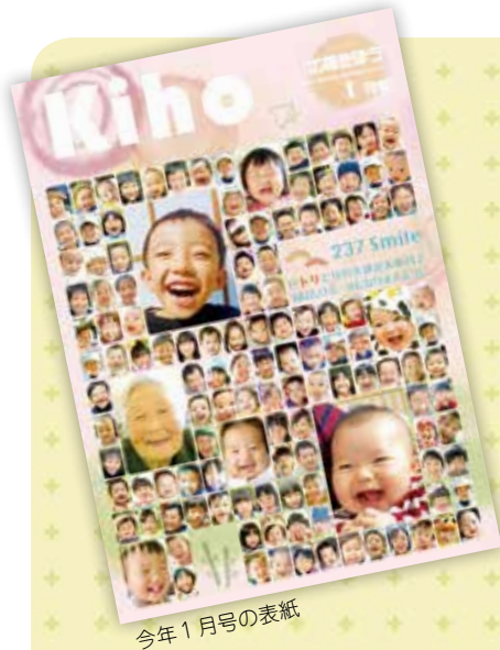
今年 1 月号の表紙