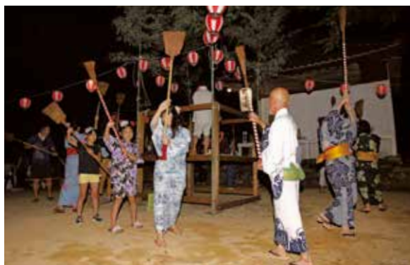
老若男女がやぐらを取り囲み踊りを奉納