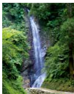
中能登町の名勝「不動滝」

今年は、7 月 29 日に開催された中能登町の織姫夏物語にスタッフとして初めて参加しました。イベントについてはまちのわだいのコーナーでも紹介していますが、紀宝町産のみかんは好評でみなさんうれしそうにみかんを買われていました。帰りに中能登町の名勝の 1 つである不動滝に行ってきました。この滝