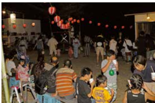
井田下り場の盆踊りに参加しました

田舎暮らしを始めて初めての夏、お盆休みに人が増えるという現象に驚きました。私の住んでい