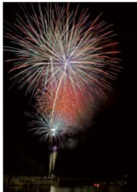
夜空に打ち上げられた大迫力の花火