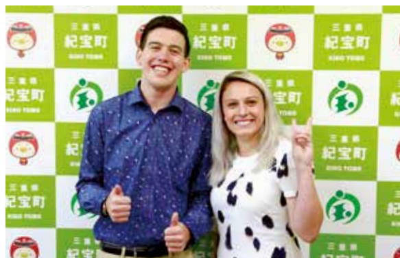
新ALTのタイラーさん（左）とベサニーさん（右）