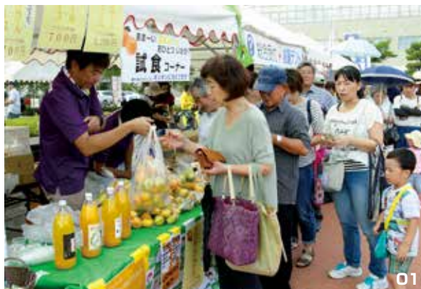
01. ハウスみかんの販売コーナーには長蛇の列が並びました。02. 迫力ある太鼓の演奏が会場を盛り上げていました。