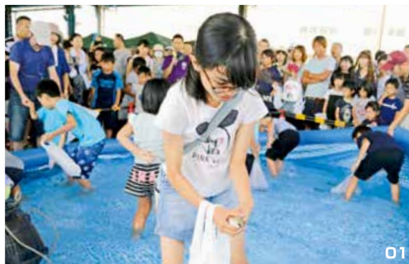
01. 魚のつかみ取り。 02. アクアボールとアクアチューブ。