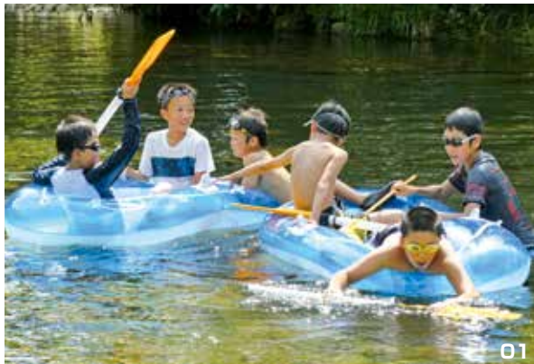
01. 相野谷川で楽しく遊ぶ。02. 竹を削って食器づくり。

その後、キャンプ期間中の食事で使う竹の食器づくりや、スイカ割り、釣り堀でアマゴ釣り、相野谷川での水遊び、キャンプファイアーなど、盛りだくさんの内容を楽しみながら、夏を満喫していました。