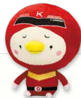
アカメレンジャー ぬいぐるみ