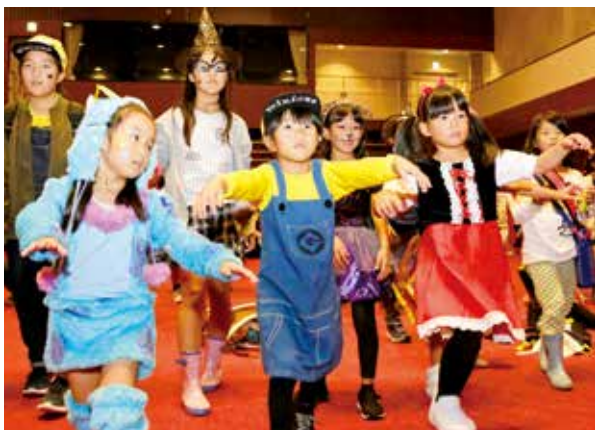
ゾンビダンスに挑戦