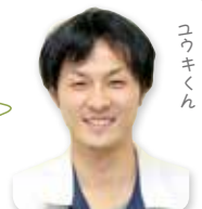
ごみのお兄さん こうきく

45ℓのごみ袋に入らない家電製品 は、「家庭用粗大ごみ戸別訪問収集」 での回収か、「粗大ごみ持ち込み」 での取り扱いになります。