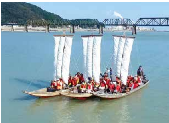
三反帆に乗船し熊野川を満喫

参加者は里山や世界遺産「熊野川」の絶景を楽しみながら、ゆったりと流れる優雅な時間を楽しんでいました。