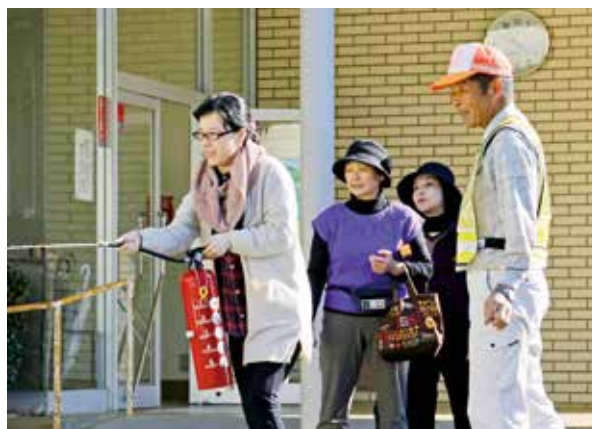
消火器の使用訓練