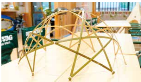
お試して作ったミニチュアのスタードーム