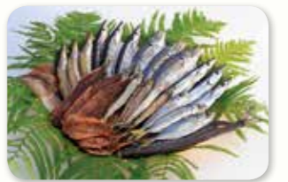
干物セット (写真はイメージです)