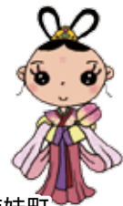
姉妹町 石川県中能登町 「郷土芸能のステージと物産の販売」