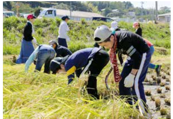
一生懸命稲を刈り取る児童たち