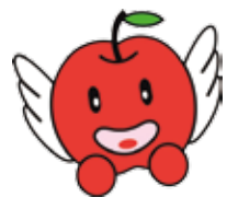
りんご「ふじ」のルーツ 青森県藤崎町 「産地直送りんごの販売」