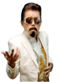
最強ものまね マロン陵

日時 10月21日（日） 午前 9時30分 ～午後 3時 ※ステージ開始は午前10時から 場所 鵜殿港 ※荒天の場合は、まなびの郷で開催