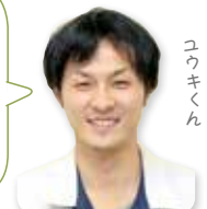
ごみのお兄さん ユウキくん

粗大ごみを出す際には、「粗大ごみ」と大きく張り紙をし、当日午前8時30分までに、わかりやすい場所に置いてください。