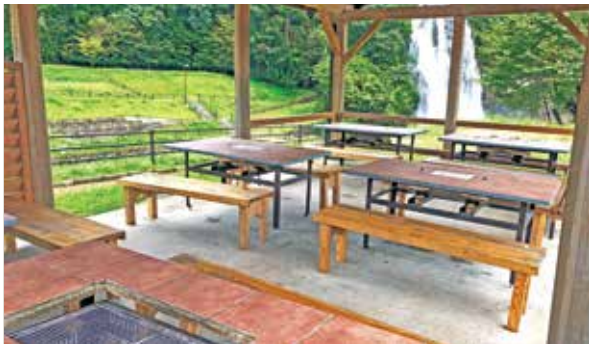
バーベキュースペース

8月には、特産品である飛雪米を使ったカレーとナメコを使ったそうめんの提供をさせていただきました。宿泊以外の方も多く来場される場所なので、もっと親しんでもらいたいと思い、今回の飲食物販売に踏み切りました。ほかのスタッフはもちろん地元の方にもメニュー開発の段階から関