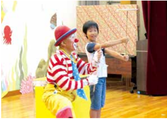
HEYちゃんといっしょに皿回しに挑戦