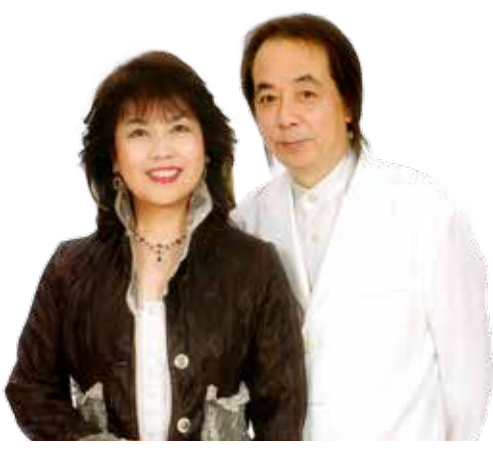
メインゲスト 紙ふうせん

▼詳しくは、今月号に折り込まれているチラシをご覧ください。役場企画調整課（☎33-0334）までお問い合わせください。