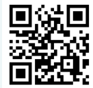
飛雪の滝キャンプ場ホームページ

飛雪の滝キャンプ場の四季折々の風景や活動内容、イベント情報のお知らせなど、随時更新しています。