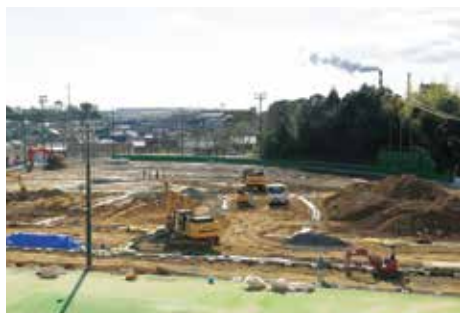
整備が進む鵜殿運動場