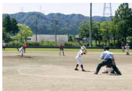
中能登町とのスポーツ交流事業