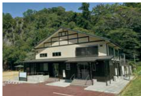
飛雪の滝キャンプ場 直売・集客交流拠点施設