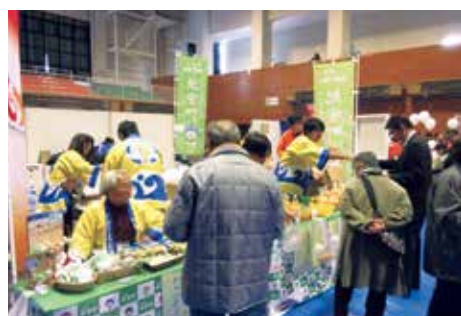
青森県藤崎町の「ふじさき秋まつり」