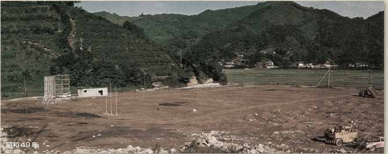
昭和 49 年

その後、深田グラウンド、テニスコート、深田農村公園などが整備され、親しまれてきましたが、平成23年の紀伊半島大水害で被災したことから平成26年にリニューアルされ、現在の姿となりました。