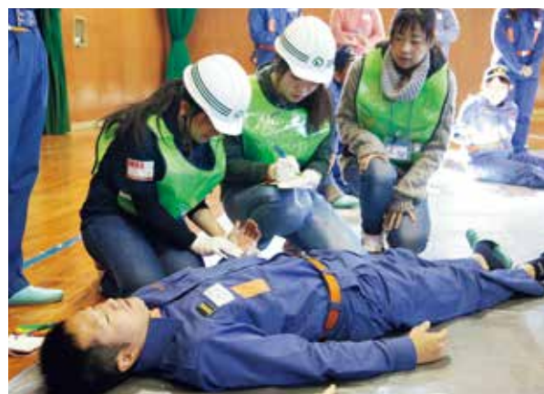
ケガの状態を確認する参加者