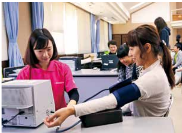
血管指標測定をする参加者

歯と口の健診・ストレステスト・血液検査・骨健康度測定・血管指標測定などのほか、体験ヨガ教室、ママサークルによるフリーマーケットも同時開催され、来場した約400名の参加者たちは気軽に楽しく、健康チェックを行っていました。