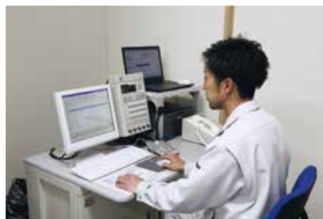
防災行政無線操作卓