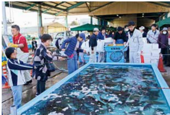
大人気だった釣り堀