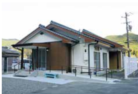
放課後等デイサービス事業所