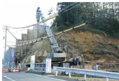
紀宝ランプ橋下部工事