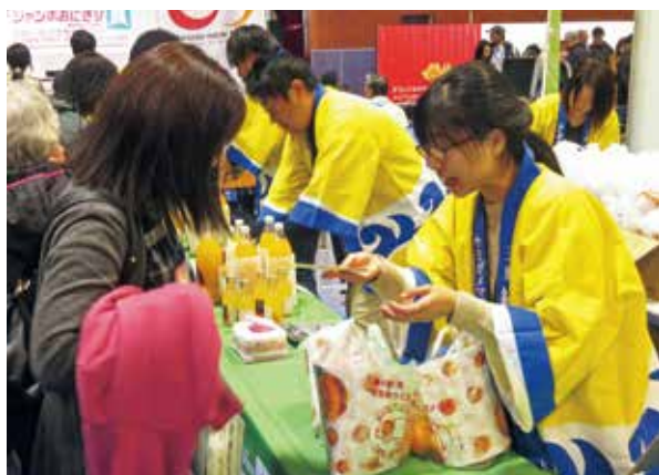
大人気だった温州みかん