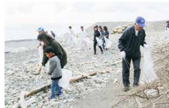
海岸を人海戦術で歩く参加者たち