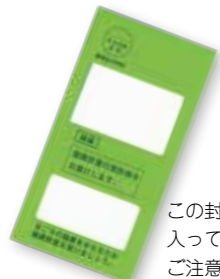
この封筒に受診券が入っていますのでご注意ください

健診は無料ですが、個別健診を受ける場合、受診券に記載された自己負担額をいったん医療機関にお支払いいただき、後日、役場福祉課に領収書等を添えて申請いただくことにより、自己負担額分を助成します。