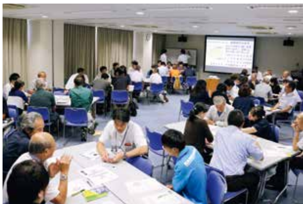
差別をなくすために熱心に議論する参加者たち