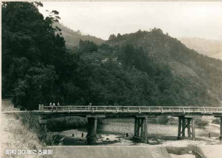
昭和 30 年ごろ撮影