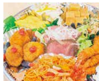
お弁当・オードブル・盛り合わせ寿し