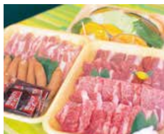
手ぶらBBQセット（牛・豚）