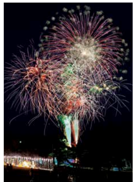
夜空に打ち上げられた大迫力の花火