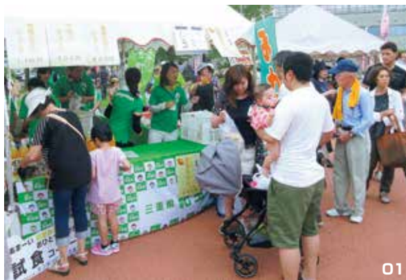
01. ハウスみかんの販売コーナーには長蛇の列ができました。02. 2団体合同で踊った熊野川小唄。