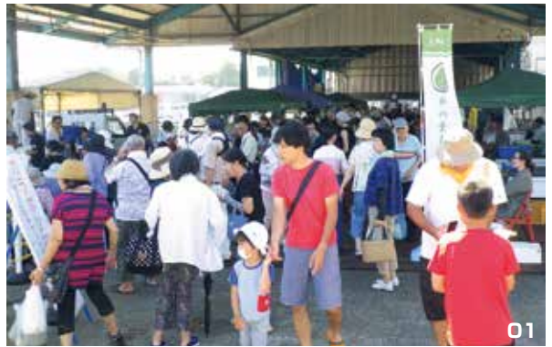
01. 大勢の来場者で賑わうみなと市。02. ガラポン抽選会。