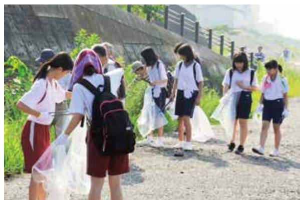
ごみ拾いをする参加者たち