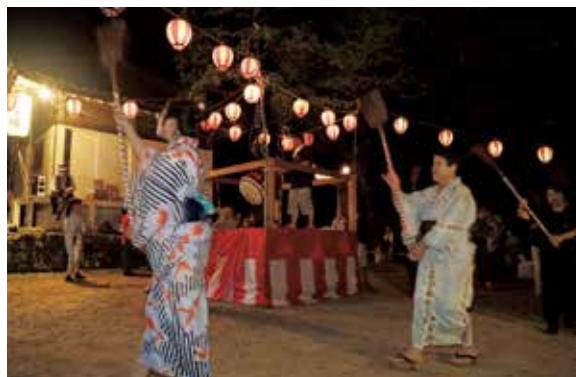
老若男女がやぐらを取り囲み踊りを奉納