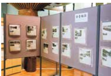
今昔物語 35 点を展示

そして、ふるさと資料館では、現在「今昔物語」の展示コーナーが設置されており、9月いっぱいまで、これまで広報で紹介してきた記事が、第1回から展示されています。 また、ふるさと資料館では、昔使われた農機具や生活用品、大里地区で発掘された羽山地遺跡の陶磁器など町の歴史に関する資料が数多く展示されていますので、一度訪れてみてはいかがでしょうか。