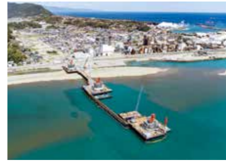
③熊野川左岸側付近