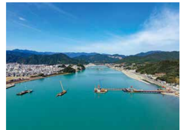
新宮紀宝道路熊野川河口大橋の進捗状況（全体）

一般国道42号新宮紀宝道路は、熊野川河口大橋を含む、新宮市あけぼの地区から紀宝町神内地区を結ぶ全長2.4kmの自動車専用道路で、国土交通省が平成25年度に事業着手し、平成30年度から町内で工事着手し、着実に事業が進捗しています。 現在までに、町内では1件の工事が完成しており、2件が工事施工中です。 令和2年度の同道路予算として、紀宝町域に41億円、令和元年度補正予算15億円