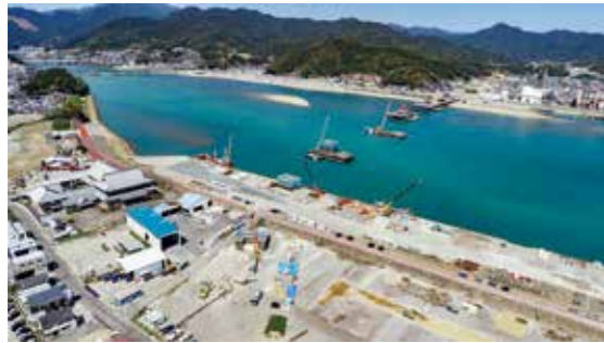
①熊野川右岸側付近