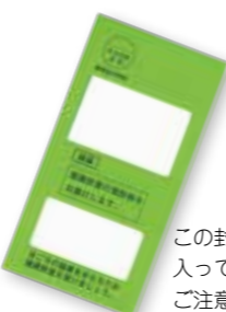
この封筒に受診券が入っていますのでご注意ください

無料です。後期高齢者医療制度加入の方は、受診券の自己負担額欄に500円(非課税世帯の方は200円)と記載されており、集団(巡回)