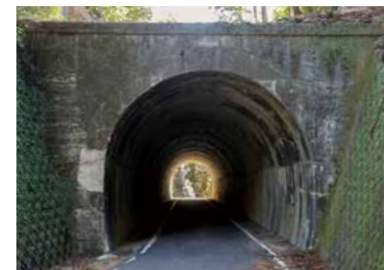
封鎖される旧相野谷トンネル