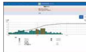
町防災情報システム