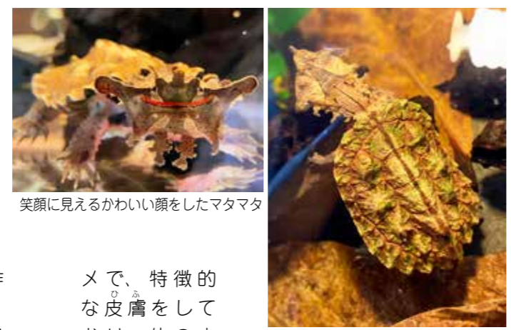
笑顔に見えるかわいい顔をしたマタマタ

今回作った水槽台は、「マタマタ」という生き物の展示用に作りました。名前だけ聞くと魚なのか、はたまたカメなのかよくわかりづらいと思います。マタマタは、南アメリカ北部から中央部にかけて分布しているヘビクピガメ科のカ