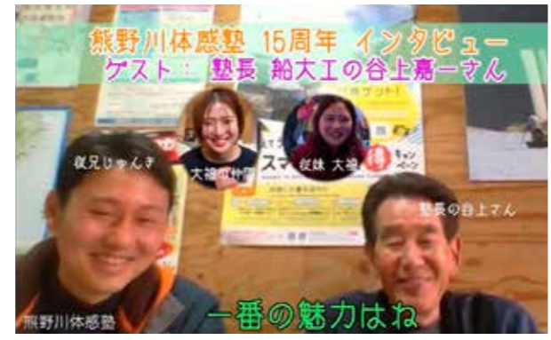
インタビュー動画の様子