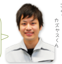
ごみのお兄さん カサヤスくん