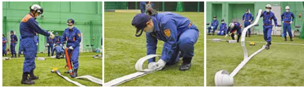
筒先をホースにつなぐ

団員たちは、お互いに協力し合いながら、訓練に取り組む、有事の際には、迅速な対応ができるよう、意識を高めました。