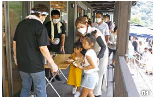
01. ちらし寿司をもらう親子。02. ヘアカット体験をする参加者。

また、大阪市の南船場にあるヘアサロン「Rollen Gleis」のオーナーによるヘアカットも行われ、参加者は自然の中でのヘアカットを楽しんでいました。