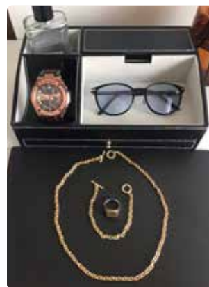
お気に入りのアクセサリ類

都会にいと何かと便利でしたが、帰ってきて田舎のゆっくりにした時間というのは過ごしやすいものだなと改めて感じています。また、都会の生活では、時間の流れが早く感じ、せかせかと動いてしまい、つい自分の時間を忘れてしまいがちでしたが、今はコ