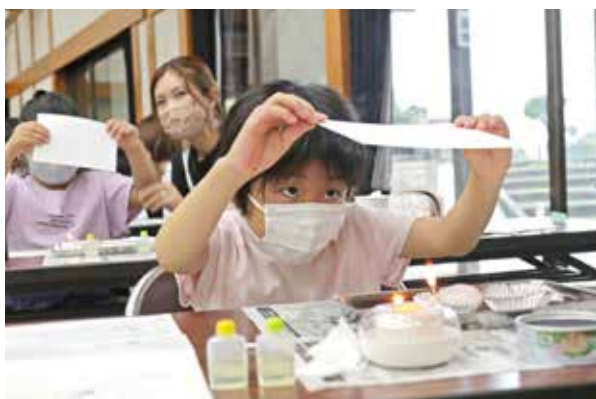
煙の様子を確認する参加者