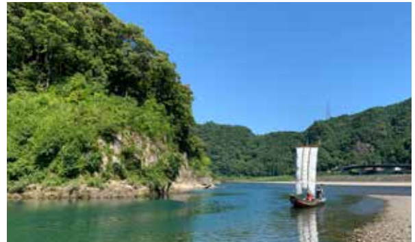
先日アップした写真

紀宝町を訪れるきっかけになればという期待を込め、投稿を続けていきたいと思うので、熊野川体感塾に遊びに来ていただいた際には、ぜひクチコミを通じて一緒に発信していただくと幸いです。