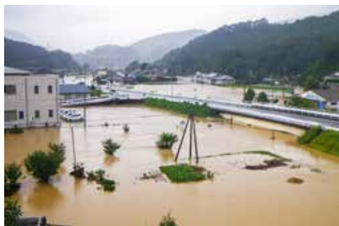
紀伊半島大水害時の成川飯盛地区

付近を通りやすいコースになり、9月はずっと日本付近を縦断しやすいコースをたどりやすい。秋台風は、速度を速めながら日本付近に近づくことが多いので、離れていても注意が必要です。