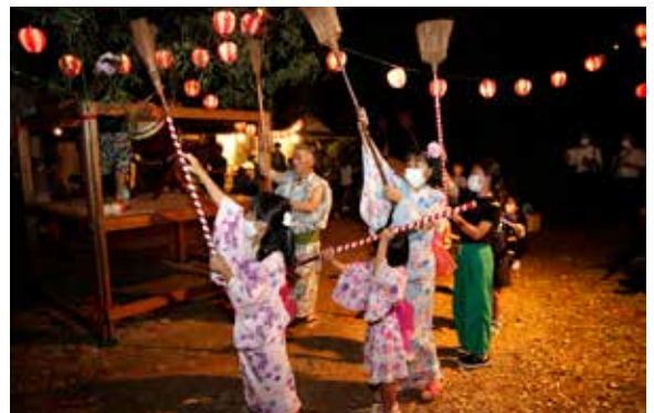
老若男女がやぐらを取り囲み踊りを奉納

参加した地域の住民や子どもたちは、やぐらを囲み、歌声に合わせて、ほうきを持ち上げたり、掃くしぐさを繰り返すなど、夜遅くまで踊りの輪が広がっていました。