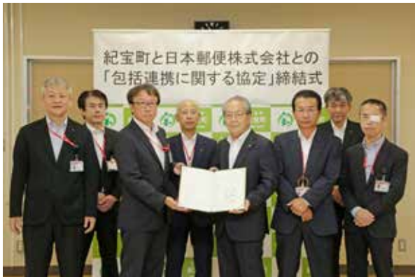
協定を締結した関係者のみなさん