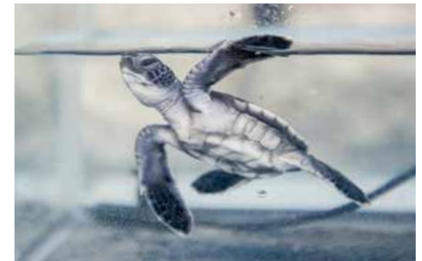
アオウミガメの赤ちゃん