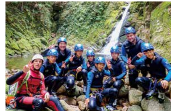
滝の前で記念撮影

9月から町内の小中学校、幼稚園で子どもたちの英語の授業のサポートを行っています。