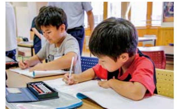
学習に取り組む小学生たち

訪れた成川小学校では、小学生たちが、夏休みの宿題や自習用のドリルなどを机に広げ、わからないところは講師に教えてもらいながら真剣に学習に取り組んでいました。