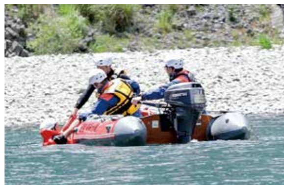
溺れた人を救助する訓練