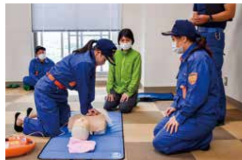
心臓マッサージの練習