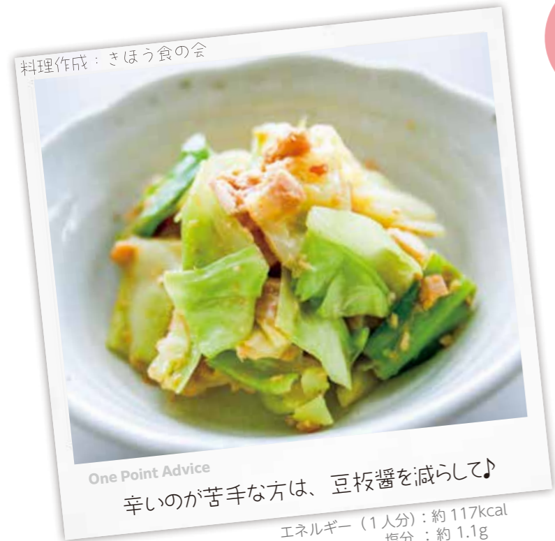
料理作成：きぼう食の会

今 回はキャベツがたっぷり食べられる「キャベツのピリ辛みそあえ」のご紹介です。キャベツは食物繊維が多いですが、実は緑色の濃い外側の葉にはビタミンCも多く含まれています。芯の周辺にも多く含まれるため、捨てずに薄くスライスし、サラダやスープなどにして丸ごと食べるのがおすすめです。やわらかい春キャベツがあるときには、生で作ってみるのもいいですね。