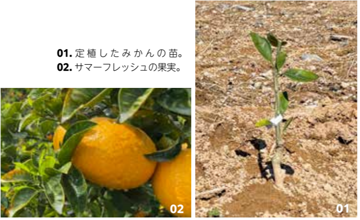
01. 定植したみかんの苗。 02. サマーフレッシュの果実。

今年もすでに葉が全て落ちている苗木が5本くらいあるので、これ以上葉が落ちないことを願うばかりです。