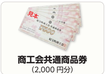
商工会共通商品券 (2,000円分)