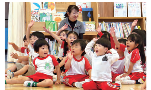
こどもの日クイズに答える園児たち