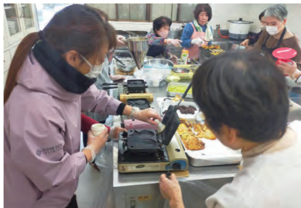
地域のみなさんと非常食を調理

3年前、地域おこし協力隊として移住した私をみなさんは、温かく迎え入れてくれました。かまどの煙にむせながら笑った日。収穫した野菜を分けていただいた日。紙皿の折り方を、やさしく教えていただいた日。その一つひとつが、今の私の原点です。