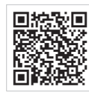
ハローワーク新宮