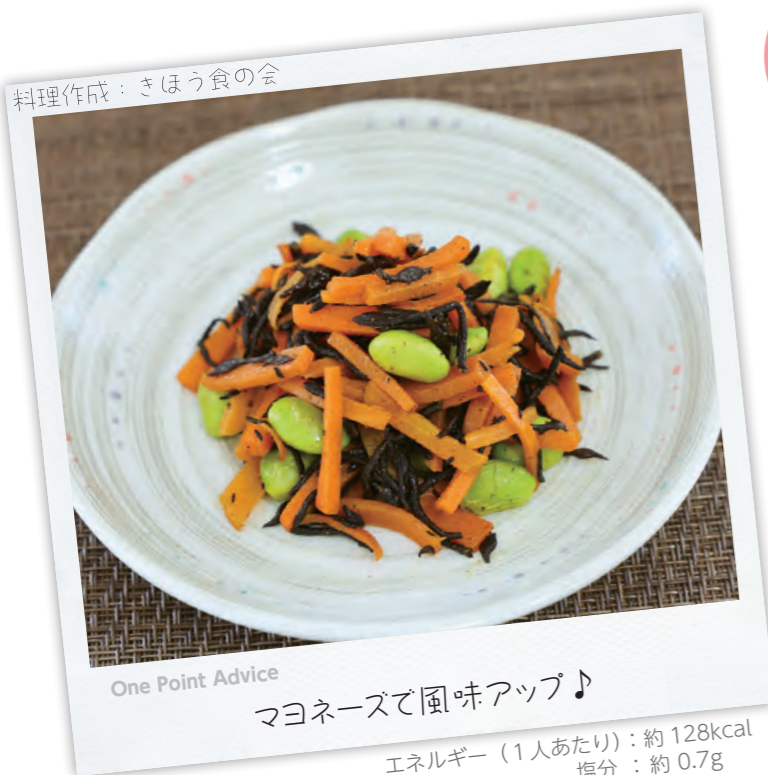
料理作成：きほう食の会