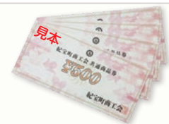
商工会共通商品券 (2,000円分)