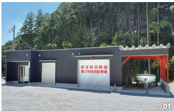
01. 完成した鮎田班消防車庫兼避難所。02. 約50人が避難できる避難スペース。