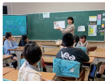
読み聞かせボランティア

つながりも少しずつ広がってきました。以前は「ないもの」に目が向きがちでしたが、今は「あるもの」に目を向け、感謝できるようになりました。家族との関係もよりよくなり、41歳の今がこれまで一番元気で充実していると感じています。