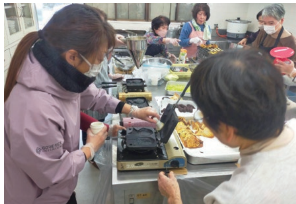
地域のみなさんと非常食を調理

3年前、地域おこし協力隊として移住した私をみなさんは、温かく迎え入れてくれました。かまどの煙にむせながら笑った日。収穫した野菜を分けていただいた日。紙皿の折り方を、やさしく教えていただいた日。その一つひとつが、今の私の原点です。