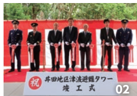
01. 完成した井田地区の津波避難タワー。02. 竣工式でのテープカット。