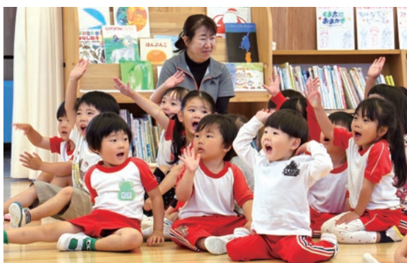
こどもの日クイズに答える園児たち