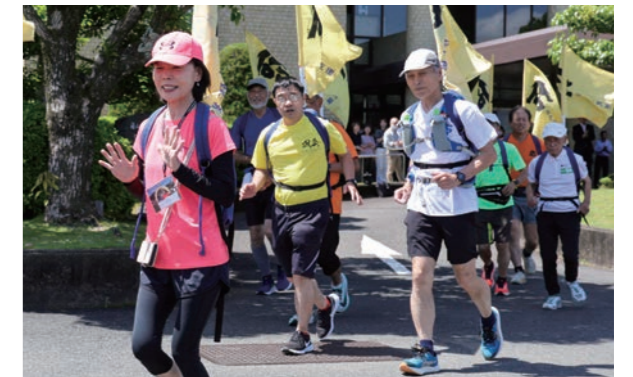
紀宝町役場を出発するランナーたち