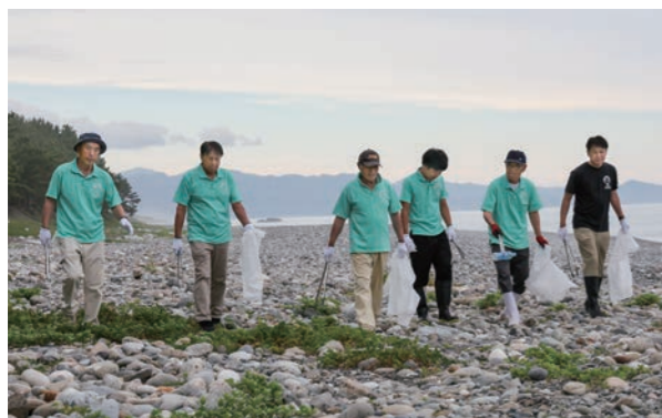
パトロールと清掃を行うウミガメ保護監視員たち