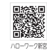
ハローワーク新宮