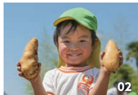
01・02. ジャガイモを収穫し 喜ぶ園児。