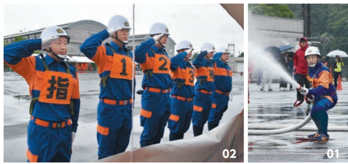
01. 火点的に向けて放水を行う消防団員。02. 競技を終え、応援者に敬礼。03. 団員が丸となって操法を行う。

現在158人の団員のうち、12人の女性団員が活躍しています。ご自分に合わせた活動が可能ですので、少しでも興味がある方など、たくさんの方の入団をお待ちしています。