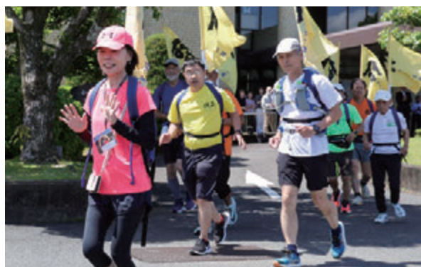
紀宝町役場を出発するランナーたち

ランナーたちは、がん研究支援、がん検診の受診推進を訴えながら、中継場所であるウミガメ公園まで走りました。