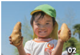
01・02. ジャガイモを収穫し 喜ぶ園児。