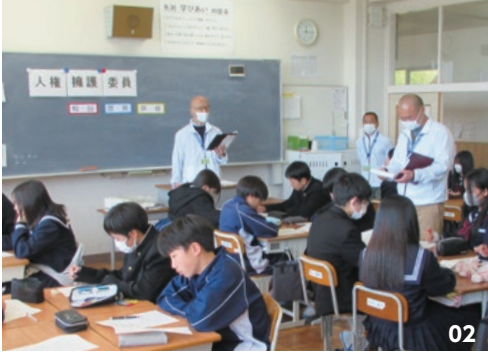
01. 人権週間に合わせて啓発活動を行う人権擁護委員。 02. 学校で人権教室を行う人権擁護委員。