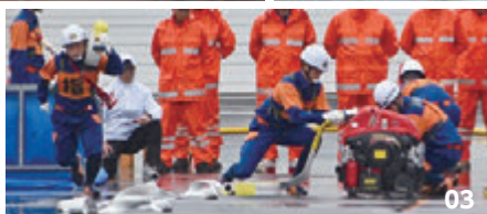
01. 火点的的に向けて放水を行う消防団員。 02. 競技を終え、応援者に敬礼。03. 団員が一丸となって操法を行う。

小型ポンプ操法は、小型動力ポンプに3本のホースを連結して約50メートル先まで延長し、さらに10メートル先の火点的に向けて放水する競技