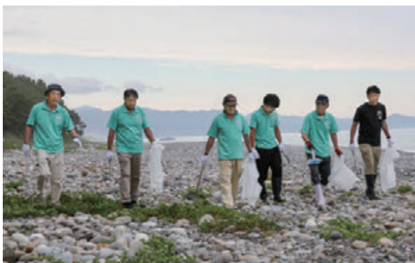
パトロールと清掃を行うウミガメ保護監視員たち