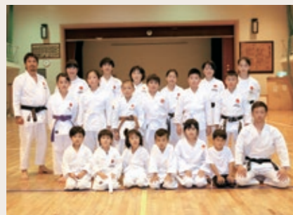
Group name 鵜殿空手スポーツ少年団