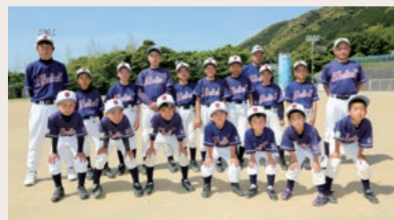
Group name 鵜殿野球スポーツ少年団