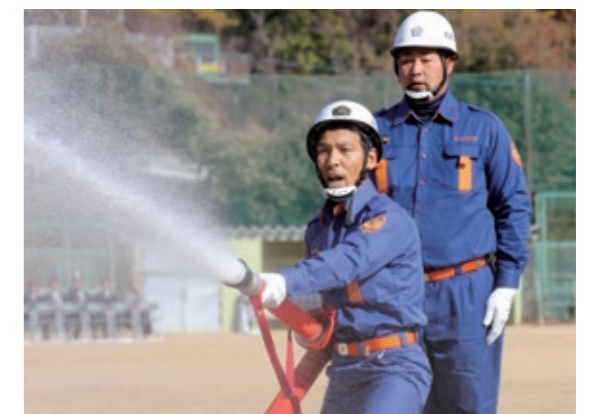
地域の安全と安心を守る消防団員