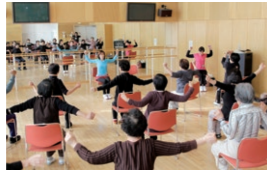
以前のエクササイズの様子

▶詳しくは、町地域包括支援センター(☎33-0175)までお問い合わせください。