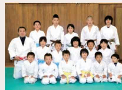
Group name 紀宝柔道スポーツ少年団