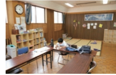
遊び場 成川旧分庁舎3階