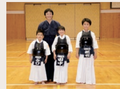
Group name 神内剣道スポーツ少年団