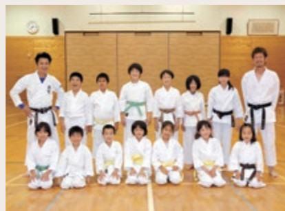
Group name 紀宝空手スポーツ少年団