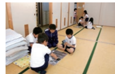
遊び場 井田公民館

◆利用日時 ・平日(月～金曜日) ・時間 午後2時～5時 (注) 小学校の長期休業日や