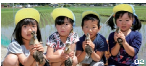
01. アイガモを水田に放す園児。02. アイガモと一緒に記念撮影。