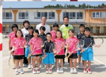
Group name 成川ソフトテニス スポーツ少年団