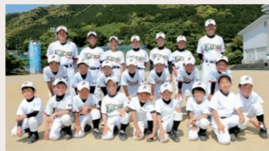
Group name 紀宝トレジャーズ