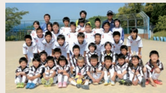
Group name 紀宝 F C