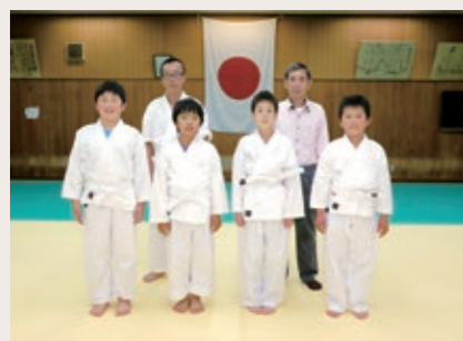
Group name 鵜殿合気道スポーツ少年団