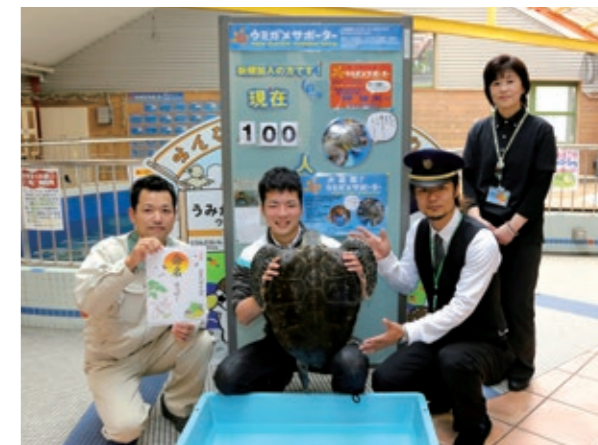
100人目の仲さん(左)囲み記念撮影。中央のアオウミガメには、「ラッピー」と名づけられました。

サポーターの協賛金は、6か月で3,000円、1年間で5,000円。ウミガメサポーター認定証が交付されるほか、サポーターの名前を書いたプレートが飼育棟に掲示されます。