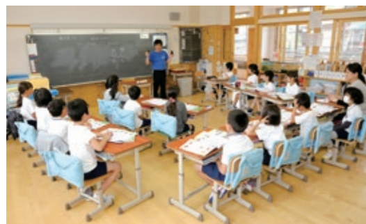
小学校の授業風景

また、9月からの本格実施を前に、6月に一度試行します。試行日については次のとおりです。