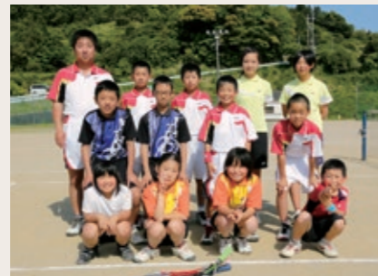
Group name 神内ソフトテニス スポーツ少年団