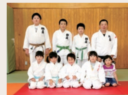
Group name 相野谷柔道スポーツ少年団