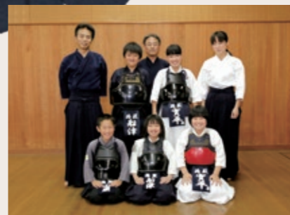
Group name 鵜殿剣道スポーツ少年団