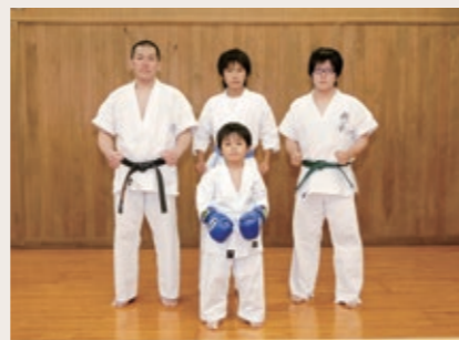
Group name 起心会 (きしんかい)