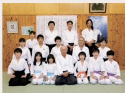
Group name 合気道紀宝支部スポーツ少年団