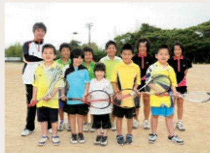
Group name 井田若草ソフトテニス スポーツ少年団