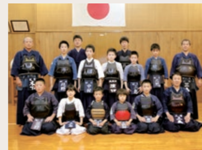
Group name 紀宝剣道スポーツ少年団