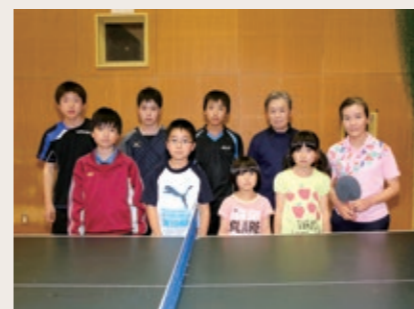
Group name 鵜殿卓球スポーツ少年団