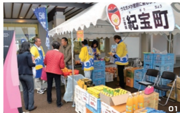
01. 紀宝町のPRを行った特設コーナー。02. 道の駅の完成を祝う記念式典の様子。

紀宝町は、道の駅のオープンを記念して、デコボンとカラを1つずつと紀宝町のPRチラシの入った袋1,000個を無料配布しました。また、販売したカラ300キロ、デコボン300キロ、サンマ寿司50本は早々に完売するほどの人気を集めました。今後は、両町の道の駅で互いの特産品を販売することにしており、両町の商工会や道の駅としても交流を深め、その効果に期待が寄せられています。