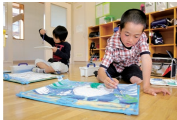
それぞれイメージするホタルを描く児童たち

各小学校で描かれた全てのホタルの絵は、6月8日(日)午前9時から午後4時まで、まなびの郷で一斉に展示されます。児童たちが描いた絵を見に、ぜひご来場ください。