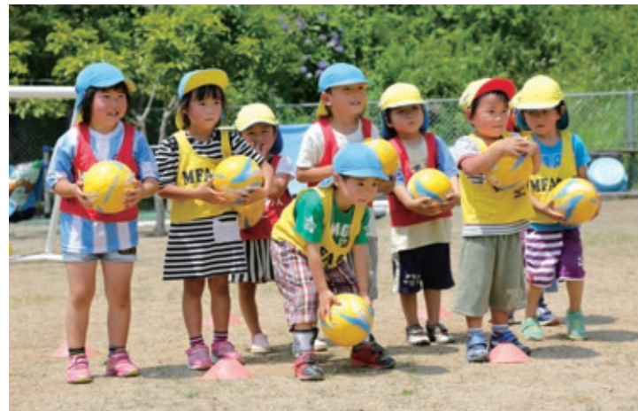
サッカーボールを使って体を動かす子どもたち