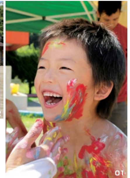
01・02・03. 初めは恐る恐る絵の具に触っていましたが、慣れてくるとその不思議な感触と楽しさに大はしゃぎする子どもたち。

園児ら46人は、赤・黄・白・黄緑の4色から好きな色を選び、全身をキャンパスにして、色が混ざることでの色の変化を楽しみながら、ぬるぬるした不思議な感触に歓声をあげて、思い思いの絵や模様を描いていました。