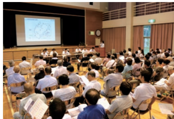
グリーンプラザで開かれた住民説明会には約200人の地域住民が参加

また、今回の説明会で示されたルートの図面を、8月20日(水)(土・日・祝日除く)まで、役場企画調整課で閲覧することができます。ご覧になりたい方は、ぜひお越しください。