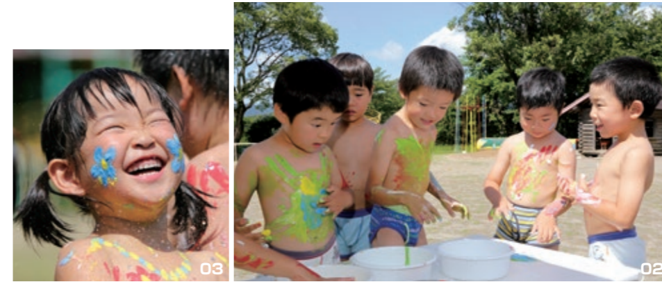
自由に描いて、感性をみがく

子どもたちは、コーチの言うことをしっかりと聞きながら、おにごっこをして体を動かしたり、ゲーム形式でボールに触れてみたりして、サッカーをめいっぱい楽しんでいました。