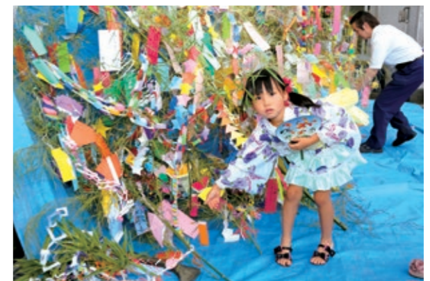
思い思いの願いごとが書かれた笹が集まりました