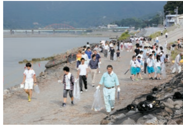
熊野川でゴミ拾いをする参加者たち