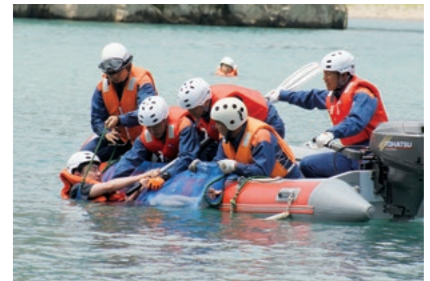
水難者を想定した救助訓練の様子