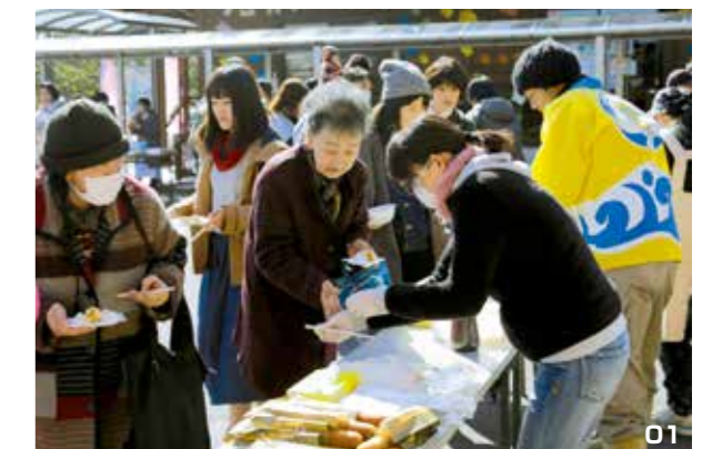
01. つきたてのお餅が振る舞われた。02. 白バイの体験乗車。

また、紀宝警察署による、伊勢志摩サミットに向けたテロ対策への協力の呼びかけ、および白バイ体験乗車も行われました。子どもたちは、はしゃいだ様子でバイクにまたがるなど、イベントは大盛況でした。