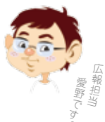
広報担当 ひょうたんや