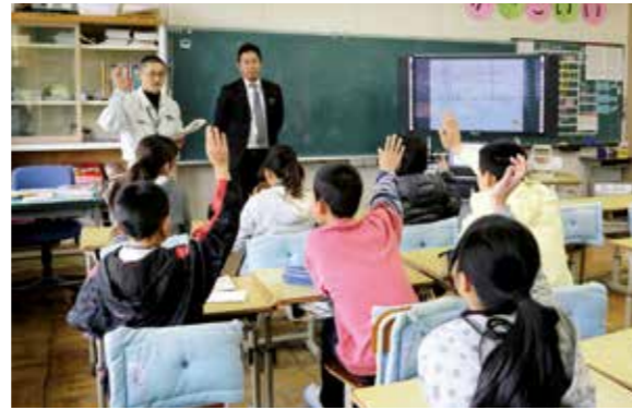
租税教室の授業風景

授業を受けた児童たちは「税金が道路や学校などに使われていることがわかった」「税金がないと大変なことになるとわかった」と税の仕組みや大切さを学びました。