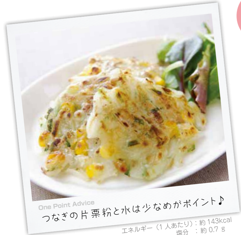
One Point Advice つなぎの片栗粉と水は少なめがポイント♪ エネルギー (1人あたり): 約143kcal 塩分: 約0.7g

玉 ねぎやコーン、納豆が入った食感が楽しいお焼きをご紹介します。 焼いたときの香ばしい香りが食欲をそそります。焼くと納豆のにおいはほとんどしませんが、軽食や子どものおやつにもお勧めです。 玉ねぎには血液をさらさらにする働きがあり、納豆には血栓を溶かす働きがあります。 また、納豆にはカルシウムやビタミンKが含まれ、強い骨を作るのに役立ちます。