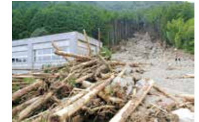
紀伊半島大水害で発生した土石流

県は、3月末に井田地区(上野地区除く)・成川地区・神内地区の89か所を、土砂災害警戒区域(イエローゾーン)土砂災害特別警戒区域(レッドゾーン)に指定します。