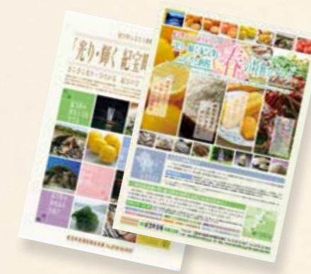
紀宝町ふるさと納税カタログ

その結果、今年度は1月末までに、延べ1750件、2千万円以上の寄附をいただきました。ぜひ、紀宝町外にお住まいのご家族、友人のみなさんに、紀宝町のふるさと納税を紹介していただきますようお願いいたします。