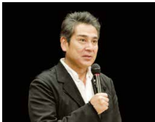
講演する宇梶剛士さん

「命には、人生がある。生きることは人生の主役を張ること。いじめや差別を遠ざけ、いつまでも健やかにすごしてほしい」と伝え、来場者は宇梶さんの波乱万丈な半生とまっすぐな生きざまに深い感銘を受けていました。