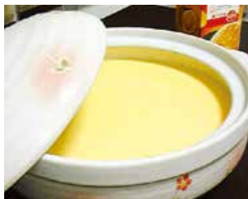
大迫力の土鍋プリン