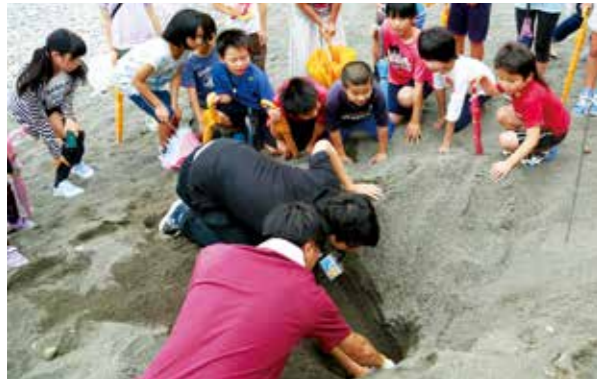
児童が見守るなかウミガメの卵を掘り返す保護監視員