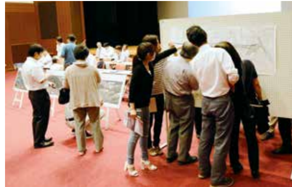
図面等を眺める参加者たち