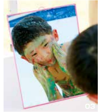
01・02・03. 体じゅうをキャンパスにして楽しくお絵描きする子どもたち。