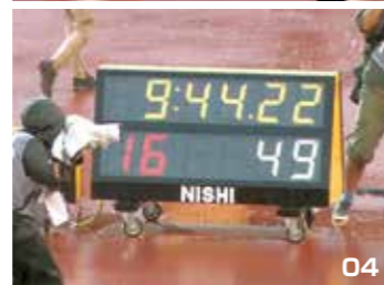
01. 第100回日本陸上競技選手権大会女子3000 m障害物でスタートラインに立つ選手たち。(写真左下のQRコードをスマートフォンで読み込むと競技の様子を動画で見ることができます。) 02. 最後の直線で全力を振り絞りゴールに向かう。 03. 障害物を乗り越える高見澤選手。 04. リオ五輪の参加標準記録9分45秒を突破する9分44秒22でゴール。(写真提供) 01・04: 日本陸上競技連盟、02・03: 松山大学