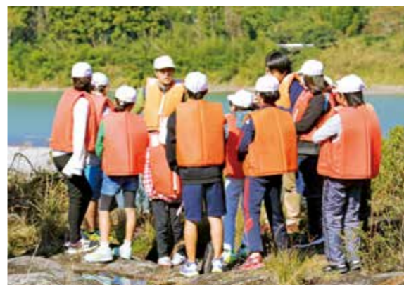
希少植物について説明を受ける生徒たち