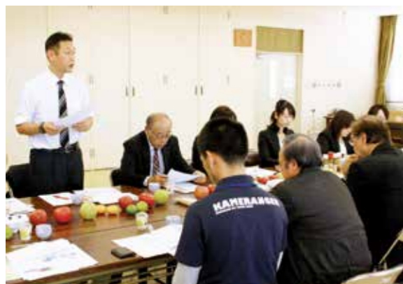
藤崎町との意見交換

一行は、町の柑橘農家や商工会、道の駅ウミガメ公園との意見交換を行ったほか、みかんやマイヤーレモンの園地を視察しました。意見交換では、今後、町と地域間連携を進め、地域資源や連携産品づくりを行っていくことを話し合いました。