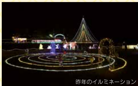
昨年のイルミネーション

また、12月17日（雨天時18日）には、イベント「キラフェス」も実施しますので、ぜひご来場ください。