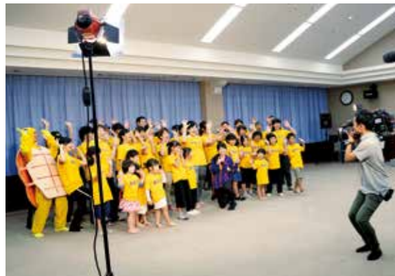
テレビ取材の様子 ※番組は11月12日に放送済