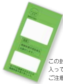
この封筒に受診券が入っていますのでご注意ください

町 では、紀宝町国民健康保険・後期高齢者医療制度にご加入のみなさんを対象に、下記の日程で特定健康診査の集団（巡回）健診、および医療機関等で受診できる個別健診を実施します。