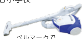
ベルマークで交換した掃除機