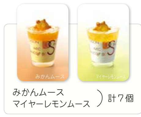
みかんムース マイヤーレモンムース ) 計7個