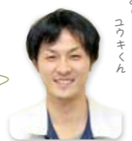
ごみのおねえさん こときくん

ポイント♪ 缶詰も同様に、水で中身をきれいに洗ってから「資源金物」の日に出すようにしてください。