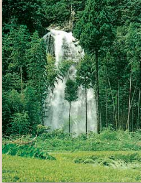
故尾崎新一郎著「郷土浅里の歩み」より転載