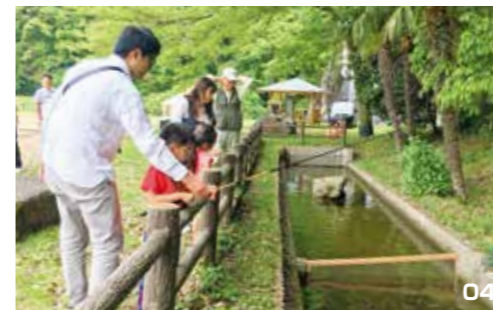
01. ダッキー体験。02. 飛雪の滝で鯉のぼりが泳ぐ。03. ガーランドフラッグ。04. アマゴ釣り体験。