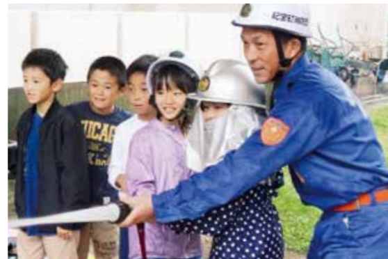
防災啓発活動を行う消防団員

また、女性団員もあわせて募集します。あなたも消防団に入って、自分たちの住むまちを守りませんか。